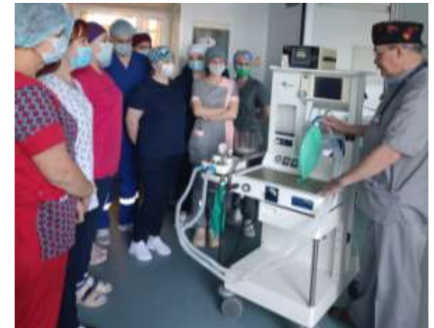
Учебный класс для слушателей БУДПО ОО «ЦПК»