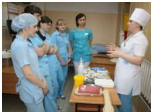
Проведение обучающих мастер-классов